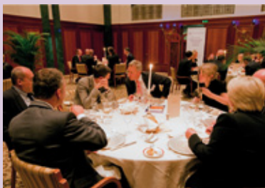
Dinner im Hotel Adlon